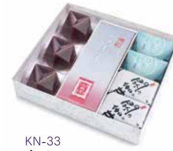
KN-33 季寄せ 3,608 円(3,340 円)

水羊羹 3 個、あも 1 本、 夏の玉露地 2 個、栗山家 3 個 ※ 5 月中旬より販売開始