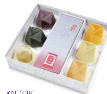
KN-33K 季寄せ 3,640 円(3,370 円)

水羊羹 1 個、抹茶水羊羹 1 個、郷の水室(梅)1 個、 あも 1 本、濃果汁(清見・林檎・白桃)各 1 個 ※ 5 月中旬より販売開始