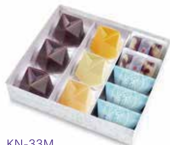
KN-33M 季寄せ 3,618 円(3,350 円)

水羊羹 3 個、濃果汁(清見・林檎・白桃)各 1 個 夏の玉露地 2 個、栗山家 3 個 ※ 5 月中旬より販売開始