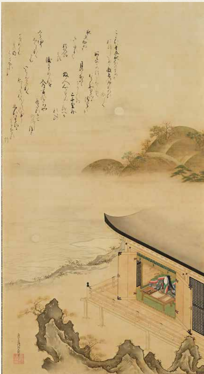
土佐光起筆「紫式部石山寺観月図」石山寺所蔵

※一部店舗では平日の販売、また取り扱わない店舗もございますので、詳しくは販売員までお問い合わせください。 ※生菓子は店頭のみ販売となり、配送はいたしかねます。