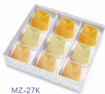
MZ-27K 濃果汁詰合せ 9 個入 2,981 円(2,760 円)

水羊羹 3 個、抹茶水羊羹 3 個、郷の水室(梅)3 個 ※ 5 月中旬より販売開始