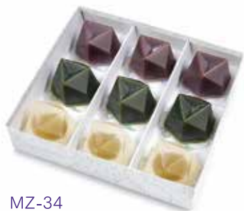
MZ-34 水羊羹詰合せ 9 個入 3,726 円(3,450 円)

水羊羹 3 個、抹茶水羊羹 3 個、郷の水室(梅)3 個 ※ 5 月中旬より販売開始