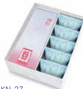
KN-27 あも・栗山家詰合せ 2,970 円(2,750 円)