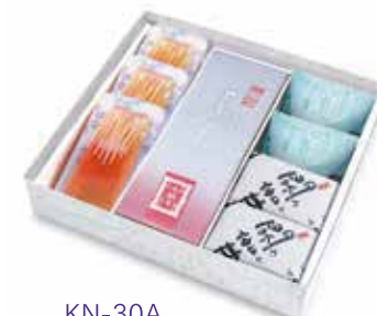
KN-30A 季寄せ 3,284 円(3,040 円)

水羊羹 1 個、抹茶水羊羹 1 個、郷の水室(梅)1 個、 あも 1 本、濃果汁(清見・林檎・白桃)各 1 個 ※ 5 月中旬より販売開始