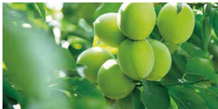
<梅狩り> 6月中旬ごろ開催予定

叶匠壽庵の本社、 滋賀県大津市大石龍門。 六万三千坪の 自然豊かな丘陵地では、 菓子の原料である 城州白梅などを 育てています。 苑内には菓子売場、 お茶室、お食事・甘味処、 ベーカリーなどが ございます。 四季の移ろいを肌で感じ、 心休まるひとときを お過ごしください。