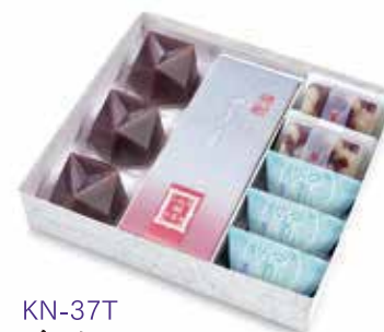
KN-37T 季寄せ 4,029 円(3,730 円)

水羊羹 3 個、あも 1 本、 夏の玉露地 2 個、栗山家 3 個 ※ 5 月中旬より販売開始