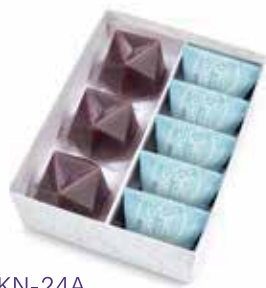
KN-24A 水羊羹・栗山家詰合せ 2,646 円(2,450 円)

水羊羹 3 個、濃果汁(清見・林檎・白桃)各 1 個 夏の玉露地 2 個、栗山家 3 個 ※ 5 月中旬より販売開始