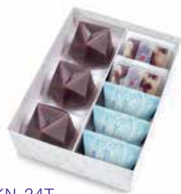
KN-24T 季寄せ 2,625 円(2,430 円)