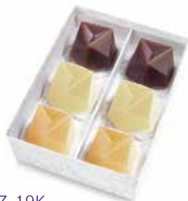
MZ-19K 水羊羹・濃果汁詰合せ 6 個入 2,074 円(1,920 円)