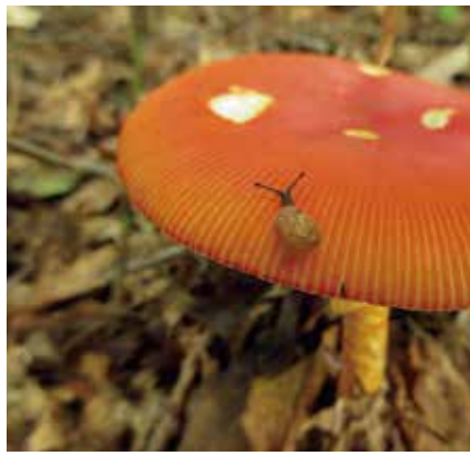
落ち葉を分解するキノコ、それを齧るカタツムリ

明治期以前の日本では、自然は人間の対象物ではなく、共生するものでもなく、人を内包して自ずと息づくものと考えられていたそうです。そんなDNAの復活を願って、これからも取り組んでゆきます。