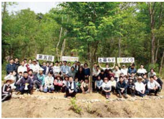
全社里山整備活動

SDGsという言葉もなかった1985年、叶匠壽庵は「農工ひとつの菓子づくり」を実践するため寿長生の郷を開きました。良いお菓子は良い農産物から、良い農産物は健全な自然から生まれるという考えのもと、果樹を植え、水や堆肥の循環システムを整え、古い炭焼窯に再び火を入れました。