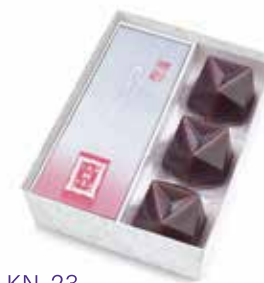
KN-23 あも・水羊羹詰合せ 2,484 円(2,300 円)